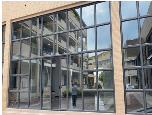
二楼理论教学区域