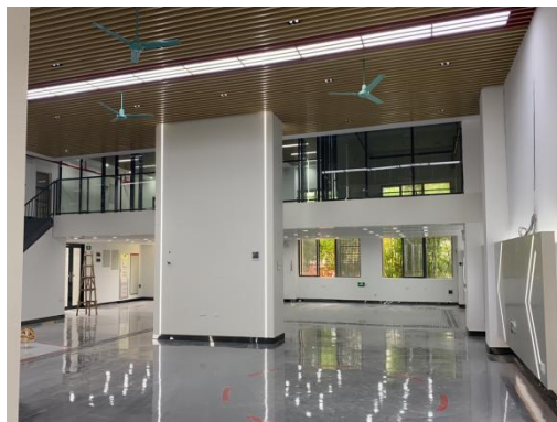
一楼实训教学区域